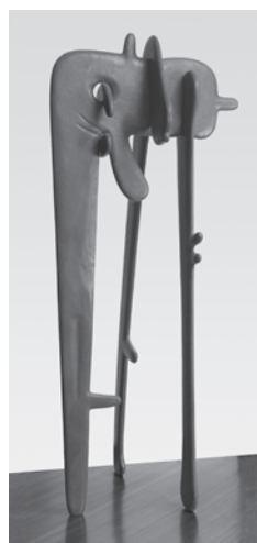
《化身》1947年 イサム・ノグチ庭園美術館（ニューヨーク） 公益財団法人イサム・ノグチ日本財団に永久貸与